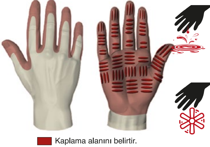
■ Kaplama alanını belirtir.